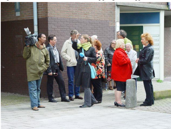
Op moederdag, zondag 8 mei jl was AT5 aanwezig in de wijk om de bewoners gelegenheid te geven te reageren op de plannen vanuit het Dagelijks Bestuur van de deelraad Zuidoost. Helaas wilde de portefeuillehouder geen medewerking aan AT5 verlenen. Het interview is uitgezonden op dinsdag 10 mei.

Holendrecht is verpauperd, zegt men in het DB. Tijdens de informatieavond toont men foto's van het winkelcentrum en van de trappen naar de bushaltes op de Holendrechtreed. Wat het Projectteam en het Dagelijks Bestuur er niet bij zeggen is dat plannen om het winkelcentrum te vernieuwen al enkele jaren systematisch op de lange baan geschoven worden. Het DB is er dus zelf (mede) schuld aan dat het winkelcentrum niet meer aan de eisen van de bewoners voldoet. De foto's van de trappen waar door vandalisme de overkapping is verdwenen slaan ook erg aan, temeer daar deze overkapping uit oogpunt