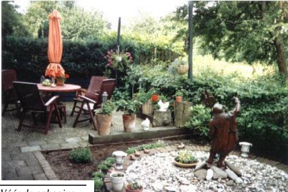
Vóór de ophoging