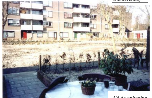
Ná de ophoging