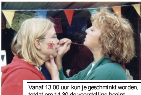
Vanaf 13.00 uur kun je geschminkt worden, totdat om 14.30 de voorstelling begint.

Daaraan vooraf gaand kunnen kinderen zich voor een klein bedrag laten schminken, pony rijden of met