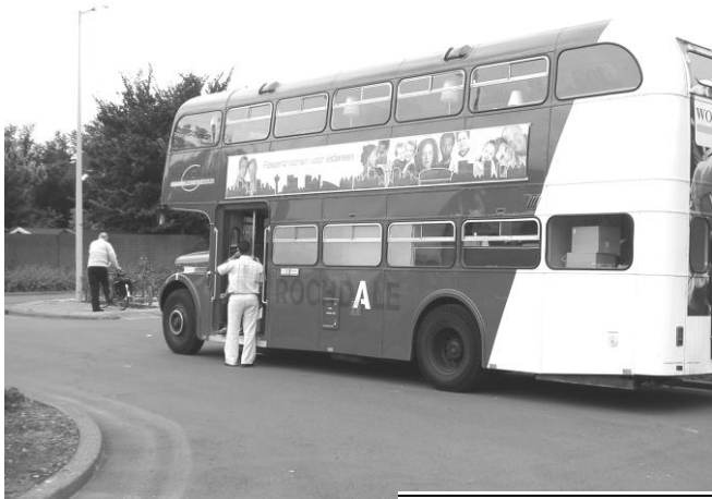
Voorlichtingsbus van Rochdale

Vroeger had Woningbouwvereniging Patrimonium een groot aantal woningen in Holendrecht West en een klein aantal in Oost in bezit. Na een grote ruil (herverkaveling) door woningbouwverenigingen in Amsterdam verloor Patrimonium al z'n bezit in Holendrecht West. Enige tijd later is Patrimonium opgegaan in een fusie met Rochdale, waardoor het bezit in Holendrecht Oost op ruim 200 wooneenheden kwam te staan. Een mengelmoes van eengezinswoningen, hateenheden, benedenhuizen voor bejaarden en galerijwoningen.