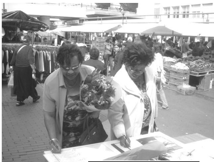
Handtekeningen verzamelen op de markt