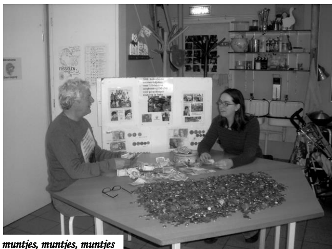
muntjes, muntjes, muntjes

Sinds augustus 2007 is meer dan 15.000 euro gegaan naar www.stichtingbaland.nl voor UMANG, een begeleid-wonen-project voor meervoudig gehandicapte kinderen, waar Brinkie's aandeel vooral uit de realisering van een zorgboerderij zal bestaan. In augustus dit jaar is een nieuwe mijlpaal bereikt. Door twaalf kilo (!) pesetas in Barcelona te wisselen kwam Stanneke terug met maar liefst 750 euro, waardoor de muntenthermometer na 7,5 jaar de mijlpaal van 150.000 euro heeft bereikt. Dus, mocht u nog buitenlandse munten en/of biljetten over hebben, de Brinkie-bussen zijn er goed voor. Dit jaar hebben we er ons verjaardagsfeestje van kunnen vieren en een nieuwe bakfiets gekocht. En ook dit allemaal weer tot plezier van kind en dier! De muntenman van de ToonBank dankt u!