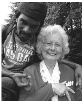
Anno_MC vs Oma Kwint

Bericht van het Bewoners Netwerk Holendrecht