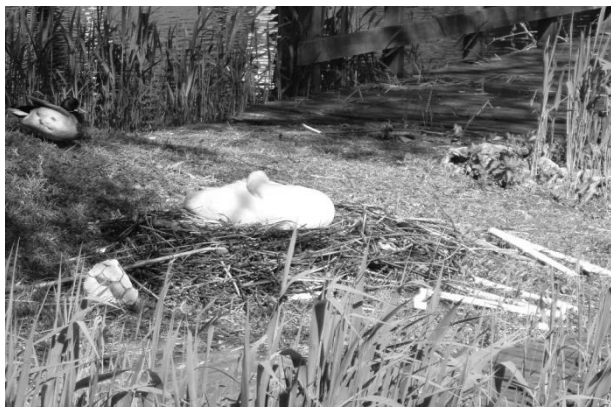
Zwaan en eend, tussen de stenen en stokken

EERLIJK gezegd ben ik soms hartstikke droef. Niet omdat Tier vertrokken is, ik zie hem vast nog wel ergens in de buurt, maar omdat ik nog steeds niks van mensekindere begrijp. Vaak vind ik ze leuk, maar er zijn er die van die rare dingen doen! Het toppunt is wel dat er kinderen zijn die echies met moedwil expres de watervogels mishandelen. Ze hebben geprobeerd een nest van een waterhoen met eieren te laten zinken door er een grote steen op te gooien. En op het eiland in de vijver hebben ze moederzwaan met harde dingen gegooid en geslagen terwijl ze op het nest ligt te broeden! Echt waar hoor, ik heb het zelf gezien! Ik wor dan erg bozig, maar omdat ik zo klein ben kan ik niet veel meer doen dan ze een schop tegen hun enkels te geven met mijn pootjes en daar