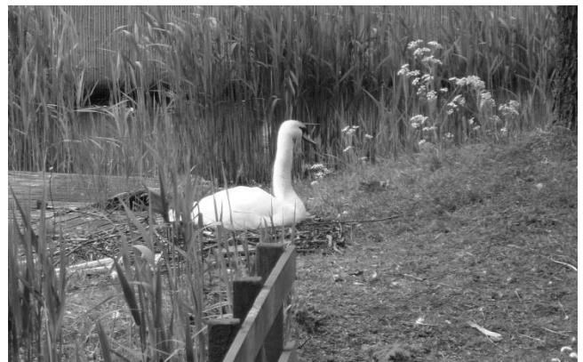
Zwaan op een schoon eilandje