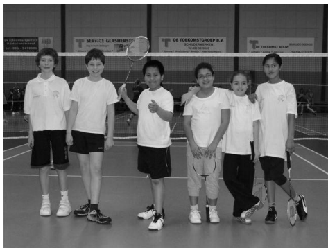
Kinderen die nu mee gaan spelen in de competitie

Bij beide woensdaggroepen kunnen er nog wel wat leden bij maar vol = vol!