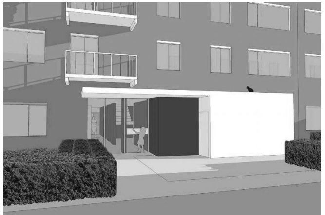
Er komen nu mooie lichte entreehallen

DE architecten moeten het plan nu verder uitwerken en gaan daarbij praten ook met bewoners over een verdere invulling van de details. Als de plannen gereed en de bouwvergunning verleend zijn, dan wil Stadgenoot de uitvoering in het najaar van 2012 starten. Het is de bedoeling om de komende jaren meer portieken in Holendrecht aan te pakken.